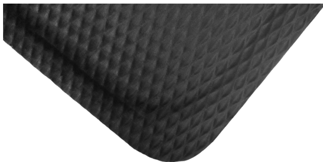
Hog Heaven avec bordure noire

Peut être personnalisé avec votre logo, votre design ou votre message (voir Impressions de Hog Heaven)